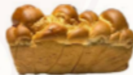
Zemplínský koláč 450g