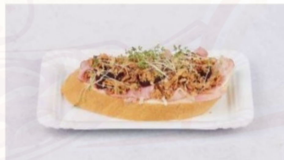
Chlebík s údenou krkovičkou 115g