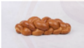
Vianočka 320g bez hroz.