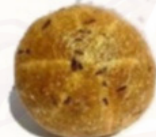
Bylinkový chlieb s chilli 450g (Sezónny)