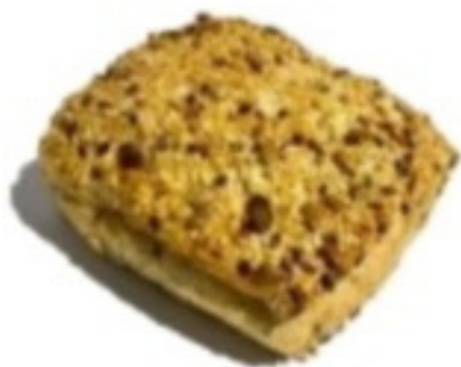
Celozrnná kocka 50g