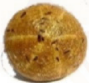
Mrkvový chlieb 450g (Sezónny)