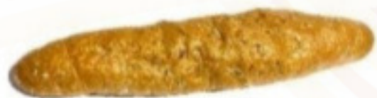
Špaldový špic 70g