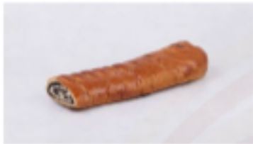
Závin s makovou náplňou 265g