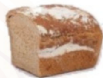
Kváskovo - ražný chlieb 500g