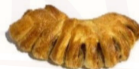
Orechový hrebeň 100g