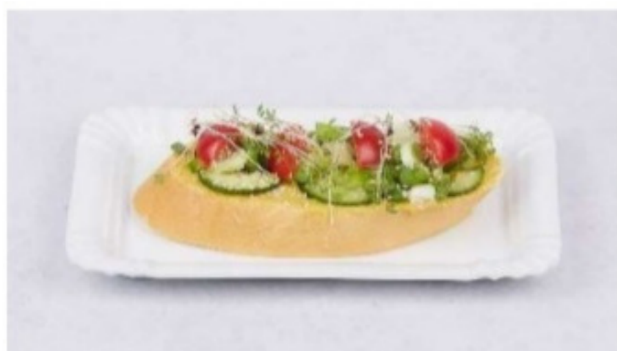
Chlebík s curry - cícerovou pomazánkou 130g