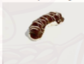
Parížsky rožok 60g