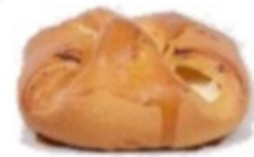
Tvarohová šatôčka 90g