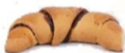
Čokoládová rolka 90g