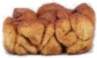
Škoricový trhanec 100g