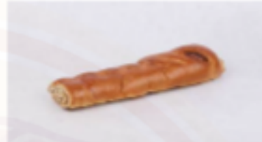
Závin s ořechovou náplňou 265g