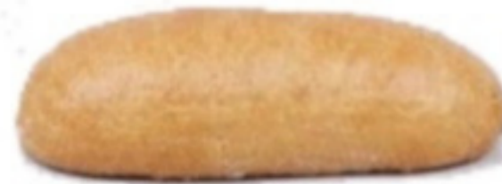
Pšeničný ražný chlieb 900g (Tmavý)