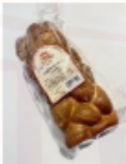
Zemplínský koláč 450g kráj.