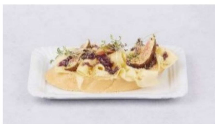
Syrový chlebík s figami 115g