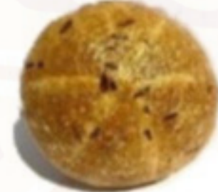
Paradajkový chlieb s rozmar. 450g (Sezónny)