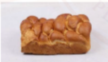
Zemplínský koláč 1000g