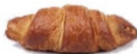
Nugatový croissant 100g