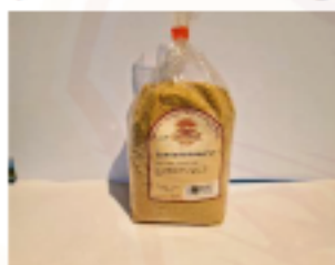
Špaldová strúhanka 500g