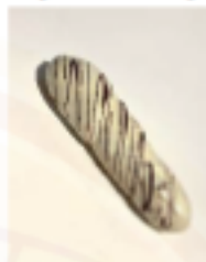
Mliečny rožok biely 80g