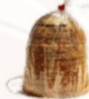
Pšeničný ražný chlieb 450g krájaný(Tmavý)