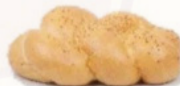
Pletenka pšeničná 135g