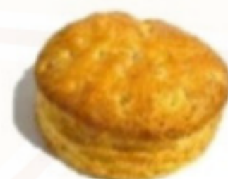
Škvarkový pagáč 56g