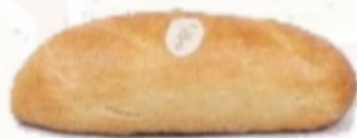
Kváskový chlieb 500g