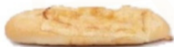
Slaninový rožok 70g