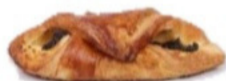
Pfundrový koláč slivka - tvaroh 100g