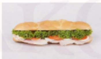
Bageta so šunkou