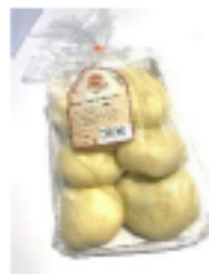
Parené buchty so sliv. lekvárom 450g