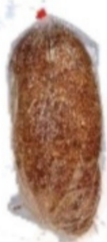
Pšen. ražný chlieb 900g krájaný(Tmavý)