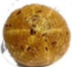
Tekvicový chlieb 450g (Sezónny)