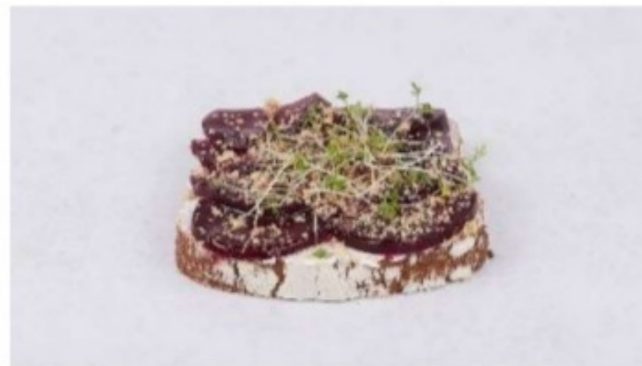
Chlebík s kozím syrom a cviklou 140g