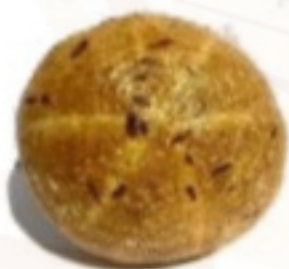
Cviklový chlieb 450g (Sezónny)