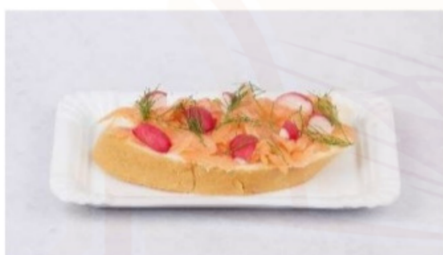
Chlebík s údeným lososom 120g