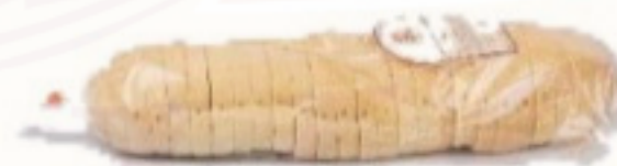
Sendvič pšeničný 350g krájaný