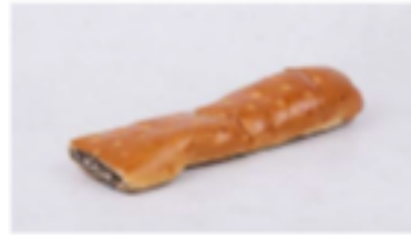
Závin s kakaovou náplňou 265g