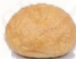
Žemľa pšeničná 90g