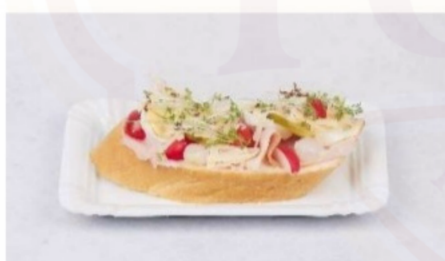
Chlebík so šunkou 130g