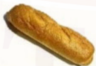
Sendvič pšeničný 350g