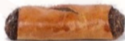
Makový zvitok 100g