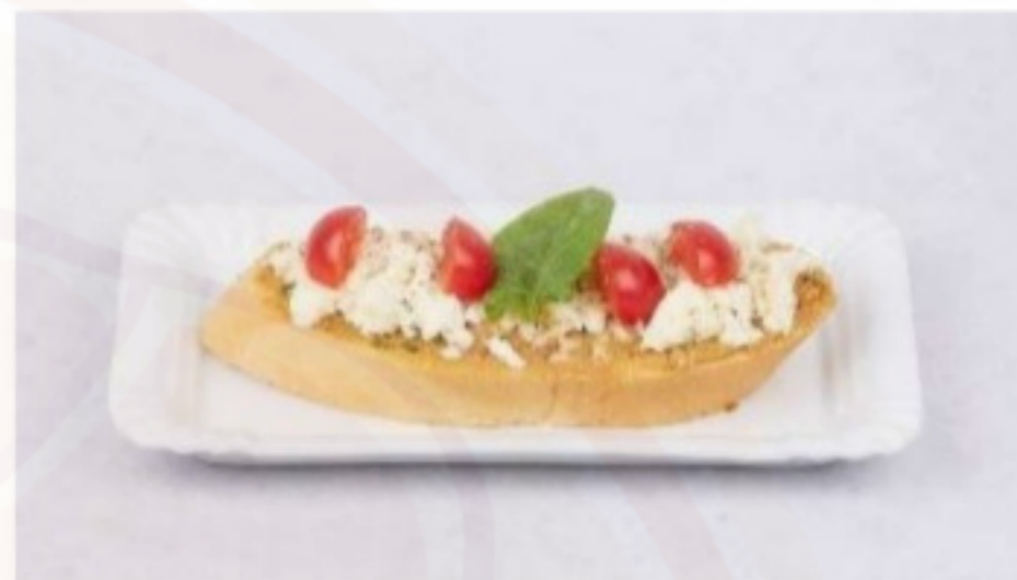
Chlebík s olivovou tapenádou 115g