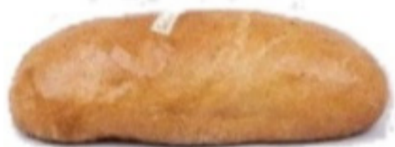
Sečovský 500g (Tmavý)