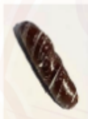
Mliečny rožok tmavý 80g