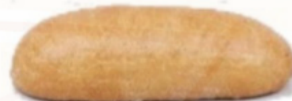
Biely chlieb 900g