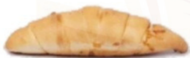
Sedliacky croissant 65g