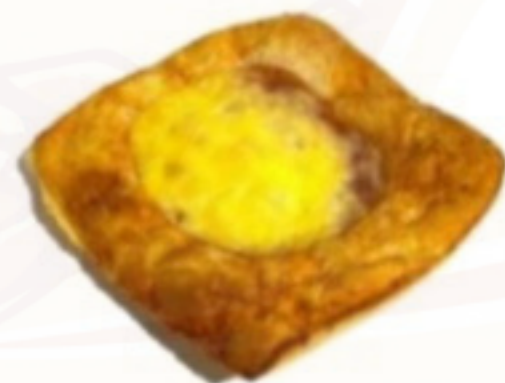
Pizzový plátok 100g