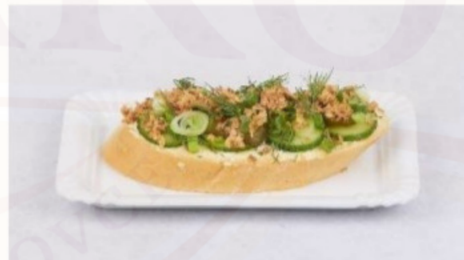
Chlebík s vajíčkovým šalátom 120g