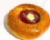
Moravský koláč jahodový 80g