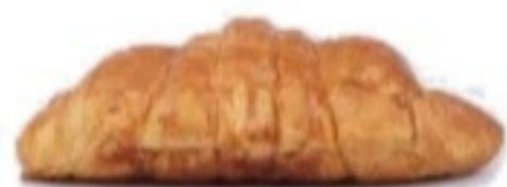
Croisant maslový 65g