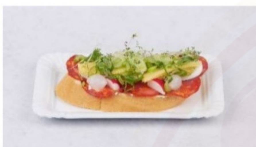
Chlebík s chorizom 120g