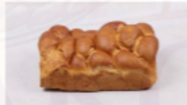
Zemplínský koláč - kakao 1000g