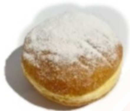
Šiška s marhuľovým džemom