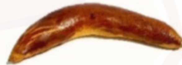
Bratislavský rožok - mak 80g